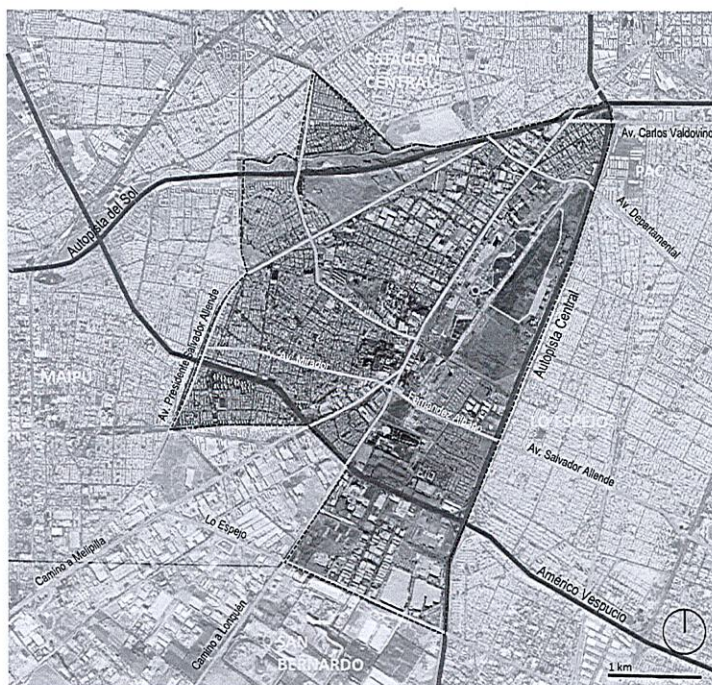
Figura 1: Ámbito de Aplicación Territorial

5. Que, el ámbito de aplicación territorial de la actualización del Plan Regulador Comunal de Cerrillos atañe el actual área urbana.